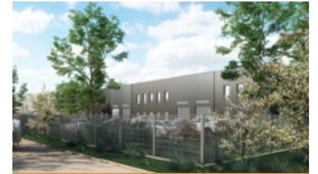
Locaux d'Activités - Travaux en cours En cours de commercialisation