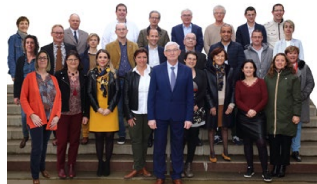
Nous vous souhaitons une belle année 2025.