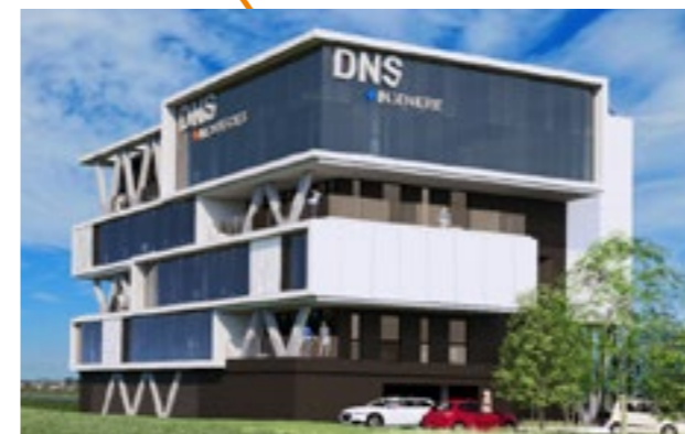
Immeuble de bureaux