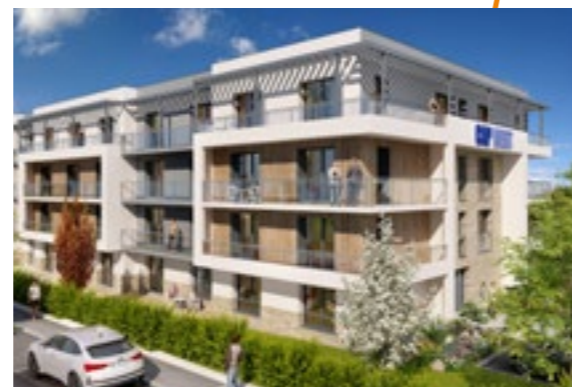
Résidence Hôtelière CapWest