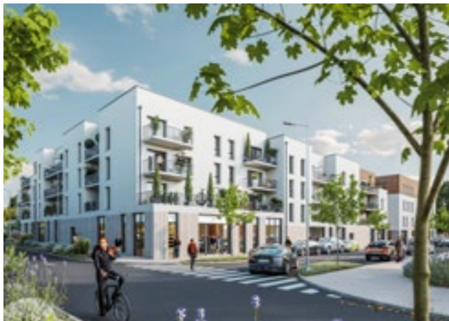
Projet mixte activités & habitat - Commercialisation en cours