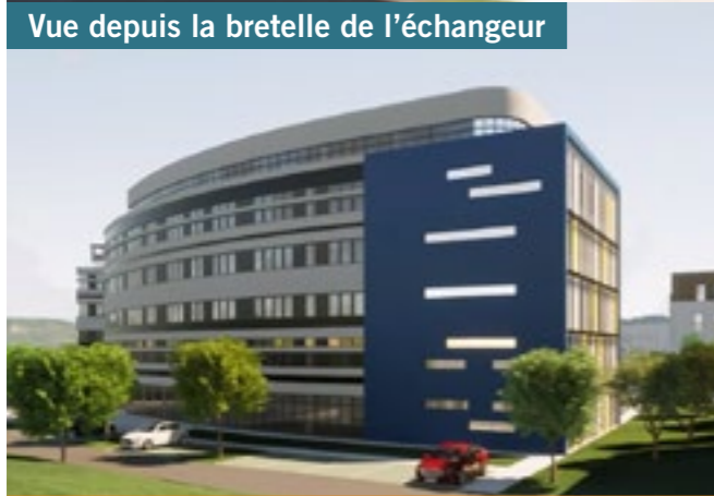
Immeuble de bureaux - A l'étude