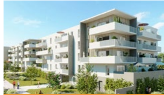
Résidence Lotus - Travaux en cours 71 logements sociaux