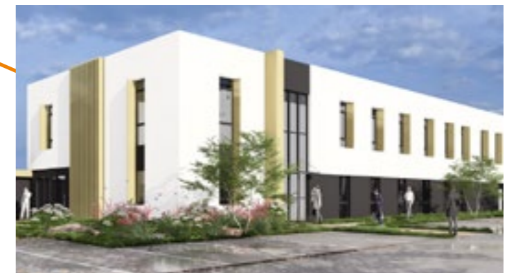
Immeuble de bureaux