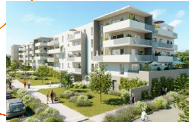
Résidence Capucine 88 logements livrés