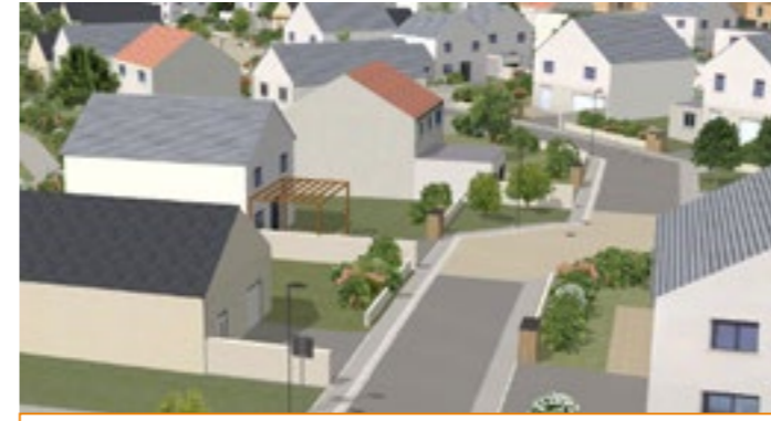
Quartier résidentiel 41 lots et 26 logements sociaux En cours de commercialisation