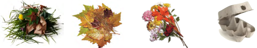
Tontes en petite quantité, feuilles mortes, fleurs fanées, carton brun en morceaux