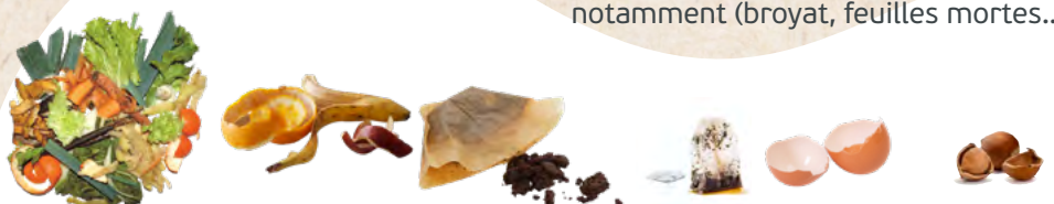
Épluchures, marc de café, sachets de thé, coquilles d'oeufs broyées, fruits à coques