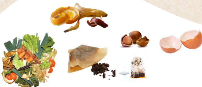
Épluchures, marc de café, sachets de thé, coquilles d'oeufs broyées, fruits à coques