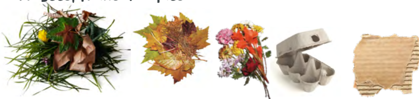
Tontes en petite quantité, feuilles mortes, fleurs fanées, carton brun en morceaux